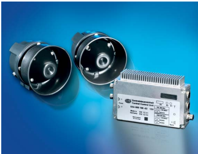
RTK-VE mit zentraler Steuereinheit ZSE-VE